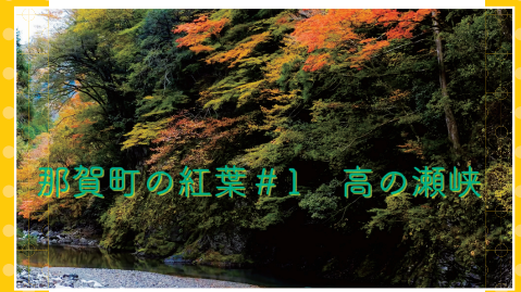
那賀町の紅葉#1 高的瀬峡

木頭地区の高的瀬峡や木沢地区の大釜の滝周辺など、那賀町には紅葉の名所がたくさん。例年の見頃は10月下旬から11月中旬頃です。